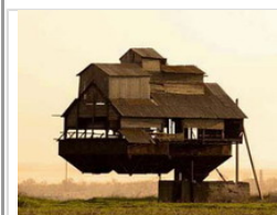
世界十大最奇怪的住宅