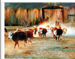
禾木：采一片初秋红叶