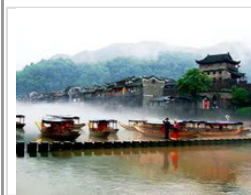
凤凰：梦里何处是水乡